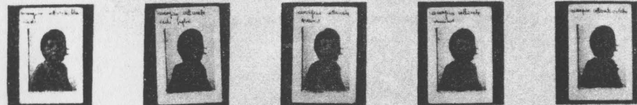
1) 1950-52 2) 1953-54 3) 1955-56 4) 1957-58 5) 1959-60 il 20 aprile 1960 la mamma ha fatto un'immagine della bambina sul suo portafoglio. L'ha mostrata sul tempo e nello spazio della sua esistenza.